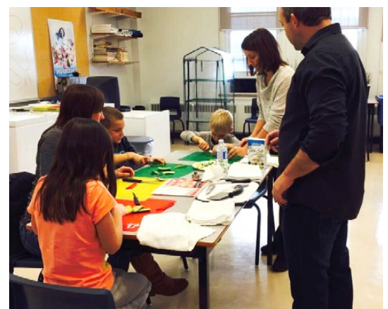
Les Forums Famille en santé à Halifax et Clare.