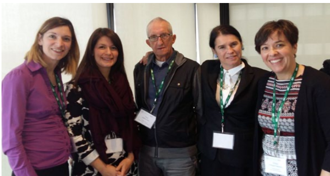
En haut : Rencontre des parlementaires lors de Connexion santé 2016 à Ottawa.