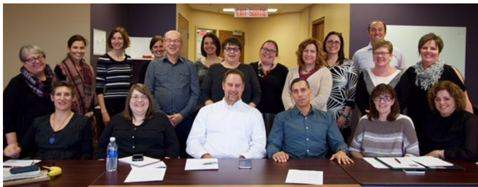
Rencontre des réseaux santé en français de l'Atlantique et de sept réseaux santé anglophones du Québec à Halifax.

Réseau Santé – Nouvelle-Écosse a participé à des réunions de plusieurs partenaires, aux assemblées générales annuelles ainsi que fait une présentation lors de l'AGA de la FFANE, ainsi qu'aux réunions du Réseau de la Petite-Enfance de la Nouvelle-Écosse et du RIFNÉ (Réseau en immigration francophone de la Nouvelle-Écosse).