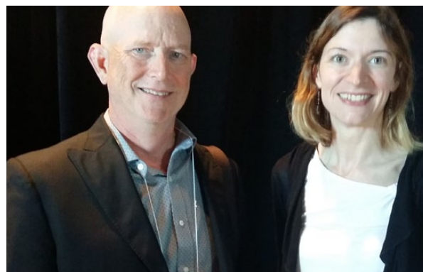
En haut : Célébration du 15 août au centre de santé IWK. En bas : Participation du Réseau Santé à l'AGA de la Régie de la santé de la Nouvelle-Écosse.