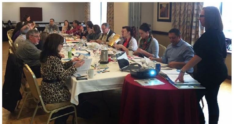
En haut : On a préparé des formatrices pour offrir la formation « Trousse d'outils pour la santé mentale des mères ».